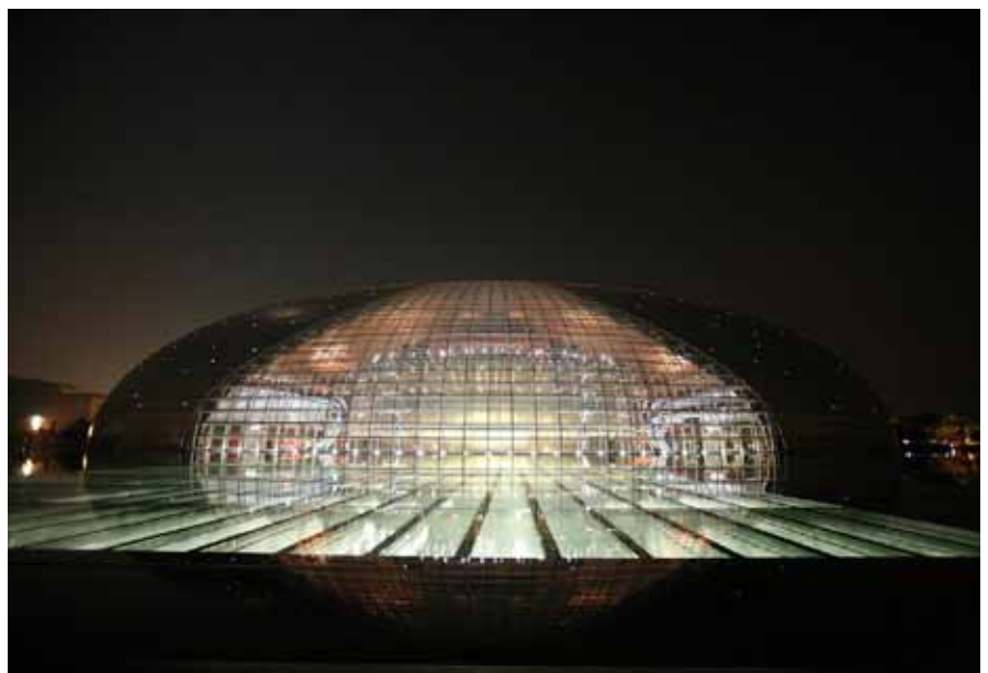
Lige vest for Folkets Store Hal i Beijing, ligger Kinas National Teater, "Ægget".

Der tages forbehold for ændringer i programmet. DaGama Travel og vore lokale samarbejdspartnere tilstræber altid at afvikle rejsen nøje i henhold til programmet, men det kan af hensyn til seværdighedernes åbningstider eller praktiske omstændigheder være nødvendigt at gennemføre ruten i en anden rækkefølge end anført. Vi gør opmærksom på, at rejsen er underlagt lokale forhold, hvor både naturkræfter og levevis er anderledes end på vore breddegrader. Det betyder at force majeure-situationer kan opstå med tilhørende forsinkelser og aflysninger, der undtagelsesvis vil medføre ændringer i rejseplanen. Vejforhold, vejforhold, problemer med køretøjer, gæsternes fysiske formåen samt forsinkede flyafgange kan medføre ændringer i rejsen og at programpunkter kan risikere at udgå. Endelig skal vi gøre opmærksom på, at alle rejser løbende revideres og søges forbedret på baggrund af de tilbagemeldinger, vi modtager efter hver rejse i