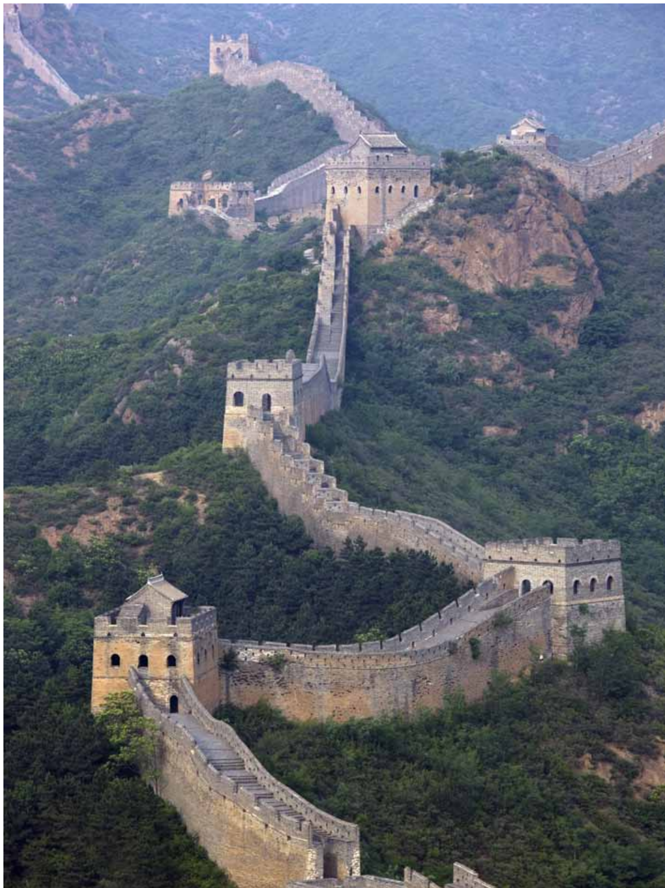
Den Store Mur mellem Jinshanling og Simatai. Også kendt som Den Kinesiske Mur.