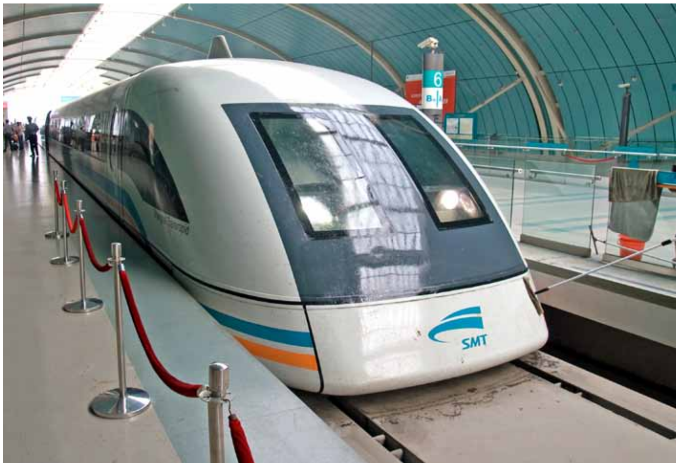
I Shanghai vil vi ved ankomsten køre de ca. 30 km fra lufthavnen med Maglev-banen, verdens hurtigste tog med en topfart på 432 km/t.