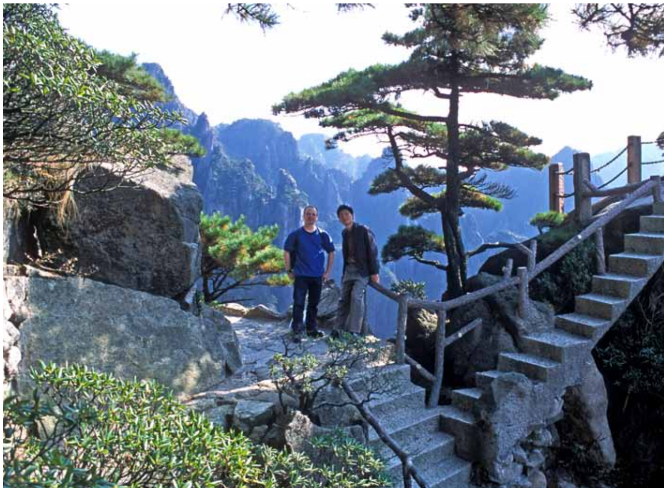
På Huangshan, De Gule Bjerge, oplever vi det fine stisystem, hvor vi i de mange pauser får tid til at nyde den bjergtagende udsigt.

heroppe, dels med gåture på det fine stisystem - og med mange pauser for at nyde den bjergtagende udsigt. Ældgamle fyrretræer i krogede former står på smalle bjergplateauer eller vokser ud fra granitklippernes sprækker. Nogle dage ruller lavt hængende skyer eller en pludselig tåge ind og indhyller området i en gråhvid dragt, der får konturerne af klipper og træer til at fremstå næsten som levende sorte skygger. Nogle af stierne heroppe snor sig dramatisk langs eller under kanten af bjergenes toppe. Mange kinesiske turister kommer her, men går man lidt væk fra alfarvej, er der stille. Frokosten indtager vi her oppe, og der bliver god tid også på egen hånd. Hen på eftermiddagen tager vi kabelbanen ned igen og kører tilbage til hotellet i Tunxin. Der er denne dag inkluderet helpension.