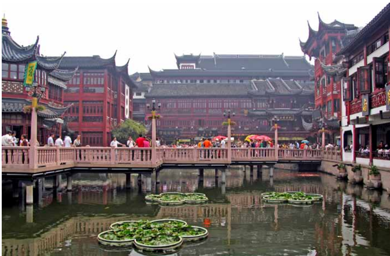
Vi besøger basarområdet med det ny renoverede tempel for Byguden og den klassiske Yu Yuan have.