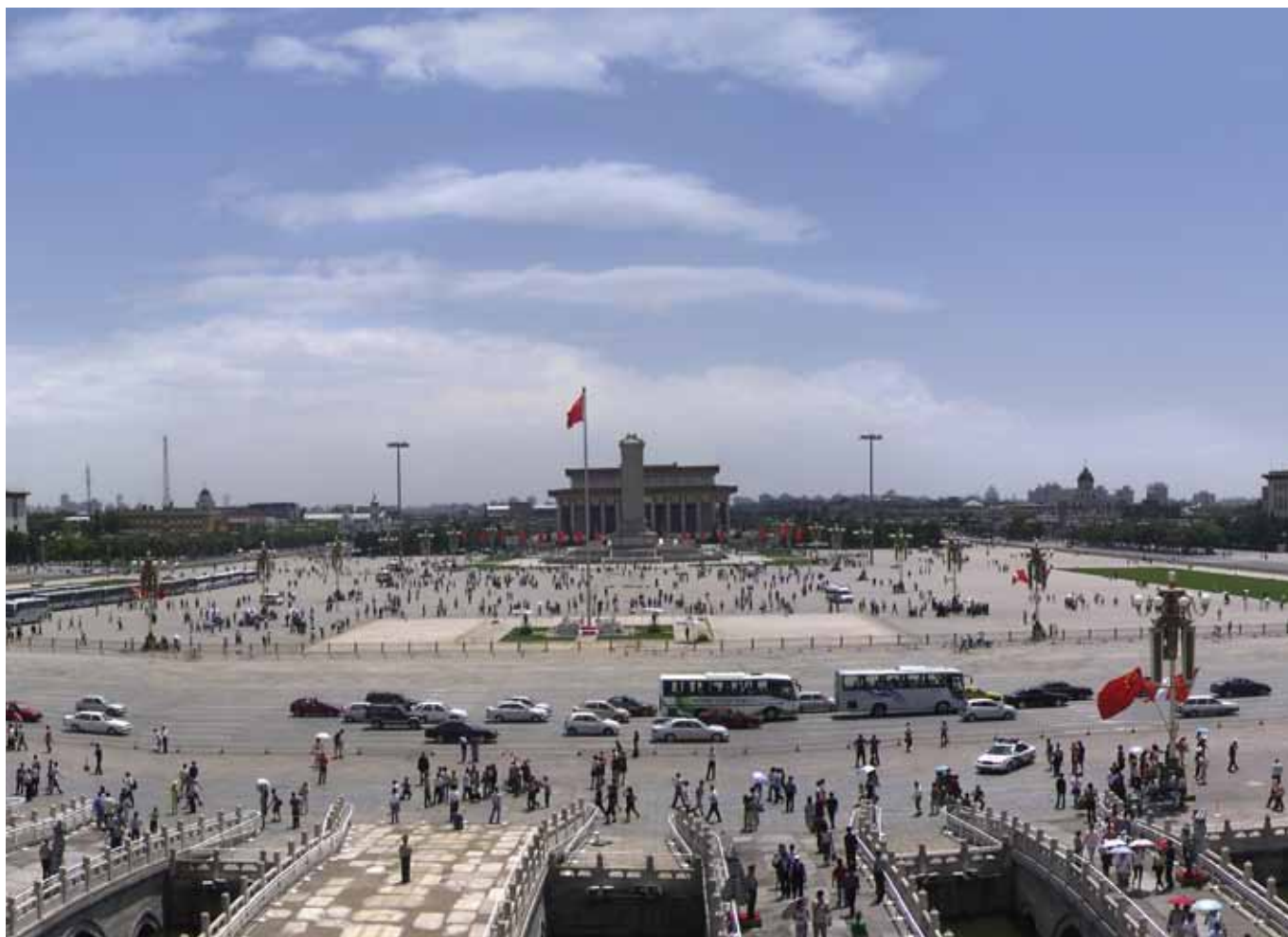
Tian An Men-pladsen er verdens største plads og har gennem tiderne været centrum for dramatiske begivenheder i Kinas historie.

Lige vest for Folkets Store Hal, ligger Kinas National Teater. Bygningen, der i daglig tale kaldes "Ægget", er en enorm kuppelformet bygning i glas og titanium, tegnet af den franske arkitekt Andreu. Bygningen ligger som en ø i en kunstig anlagt sø med adgangsvej via en glasklædt