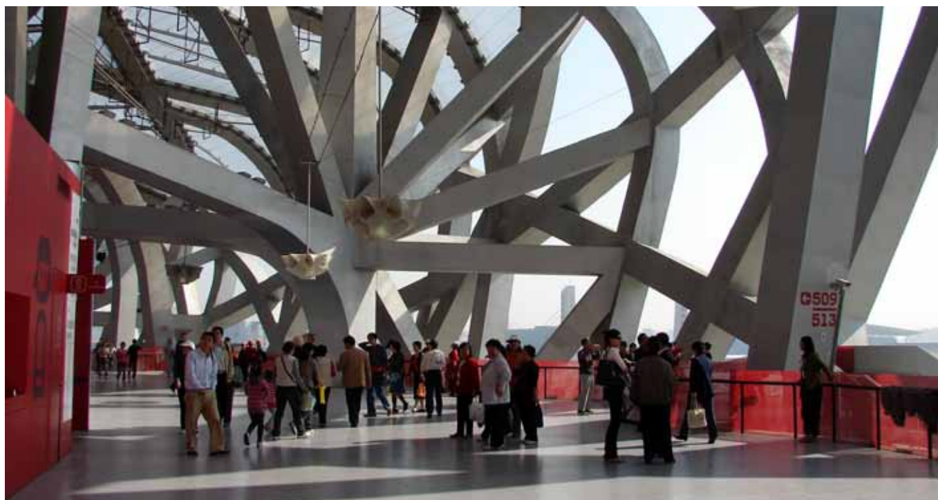
Hovedstadion i Beijing, "Fuglereden", af Herzog og De Meuron, bød på den flotteste olympiske åbningsceremoni til dato.

Der er denne dag inkluderet morgenmad på hotellet, samt fortæring ombord på flyet.