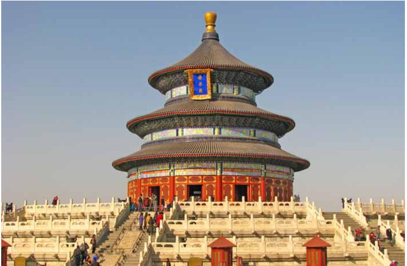
Himlens Tempel var det vigtigste religiøse kompleks i det gamle Kina, hvor kejseren kunne holde sig på god fod med himlens magter.