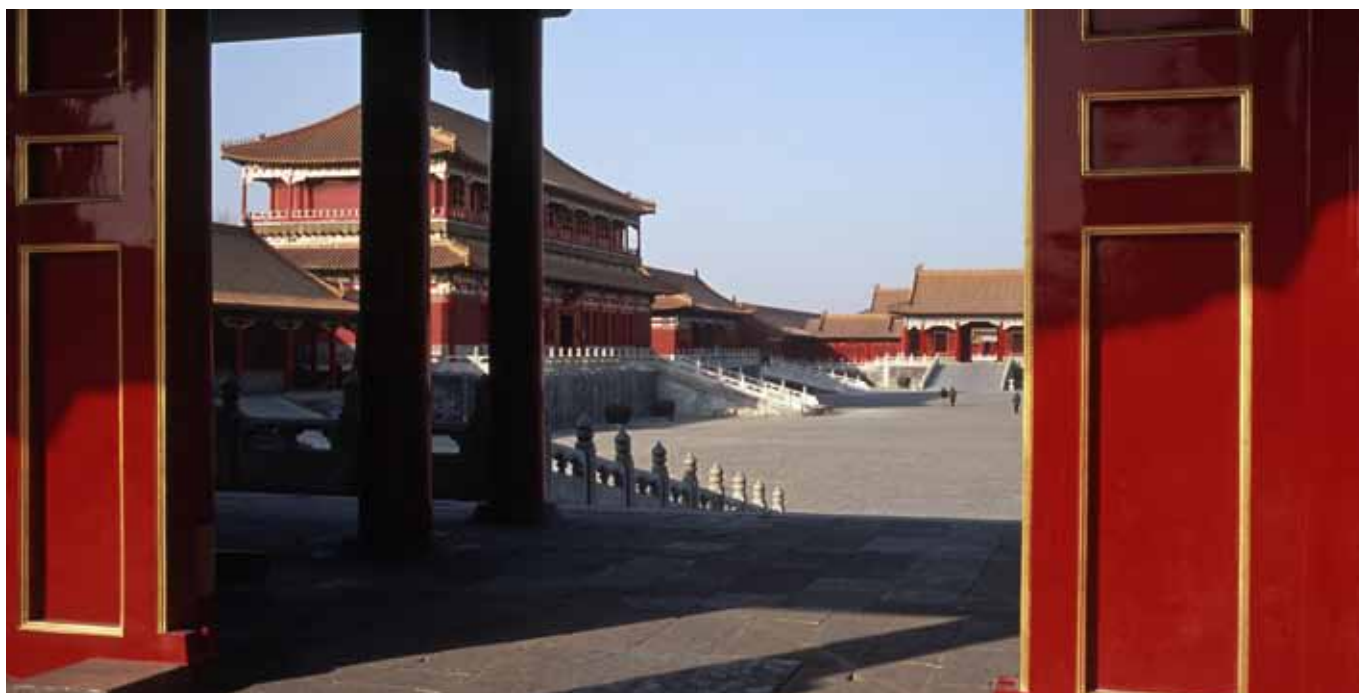
Et af højdepunkterne under et besøg i Beijing er Gugong, Den Forbudte By, hvor kejserfamilien boede.

Hoved-stadion'et, "Fuglereden", designet af Herzog og De Meuron, bød på den flotteste olympiske åbningsceremoni til dato. Bygningsværket er i sig selv en arkitektonisk seværdighed. Det 330 meter lange, 220 meter brede og 62 meter høje stadion kan rumme 80.000 tilskuere. Tæt ved ligger det ikke mindre interessante Nationale Svømmestadion. Det er designet af et australsk firma,